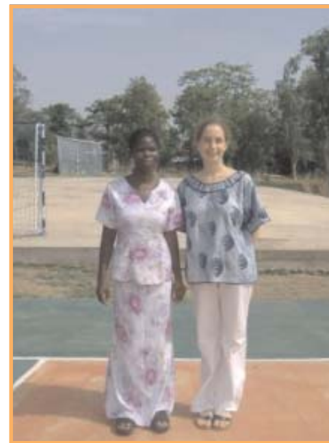
Avec une étudiante de l'Université de Kara, sur le terrain de basket du campus.