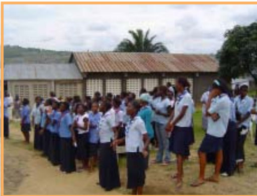
Week-end d'ouverture de l'année pour les Guides Catholique de la RD Congo

également pu faire la connaissance du milieu scout et guides du Congo. Contrairement au mouvement Scouts et Guides de France, ici les Scouts et Guides Catholique du Congo n'ont pas fusionnés. Ces deux mouvements scouts ont été victimes des difficultés politiques et économiques du pays. Longtemps interdits, ils recommencent à réapparaître timidement. Les chefs scouts manquent de formation, de moyens matériels et financiers. Le Congo en général souffre d'un