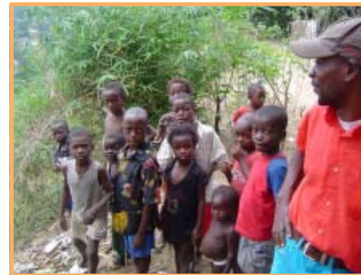
Un groupe d'enfant qui nous suivait