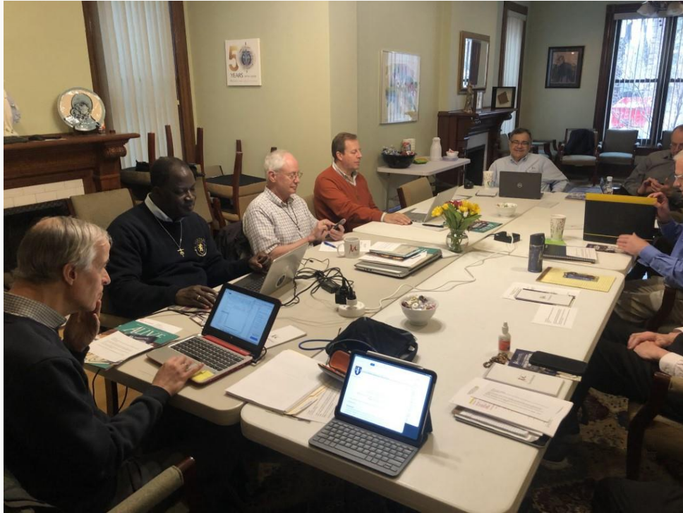
Le Conseil général rencontre le Conseil provincial à la fin de la visite.

Il y a, bien sûr, des défis à relever dans la province. La taille même de la Province est un grand défi pour les membres de l'administration provinciale, et de nombreux efforts sont déployés pour assurer l'unité de tout cet ensemble. Néanmoins, tous travaillent à préserver et à renforcer la vie religieuse marianiste au sein de la Province. Le Conseil général a exprimé sa gratitude, non seulement pour l'accueil reçu, mais aussi pour le rôle important que joue la Province des USA au niveau international. Souvenons-nous des œuvres religieuses et apostoliques de cette Province dans nos prières, en demandant la bénédiction de Dieu et la protection maternelle de Marie !