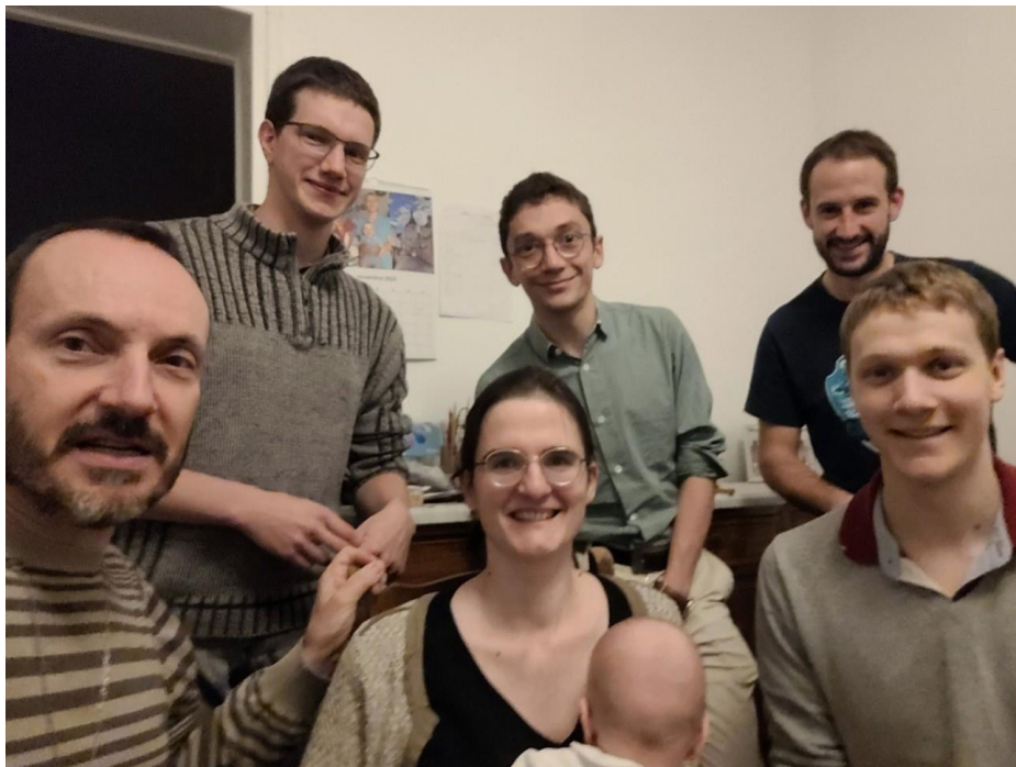
Membres de la Fraternité Faustino

Suite aux activités de la pastorale des jeunes au lycée et aux camps JFM (Jeune de la Famille Marianiste), notamment à Valence en 2013, nous avons créé une fraternité marianiste appelée Faustino.