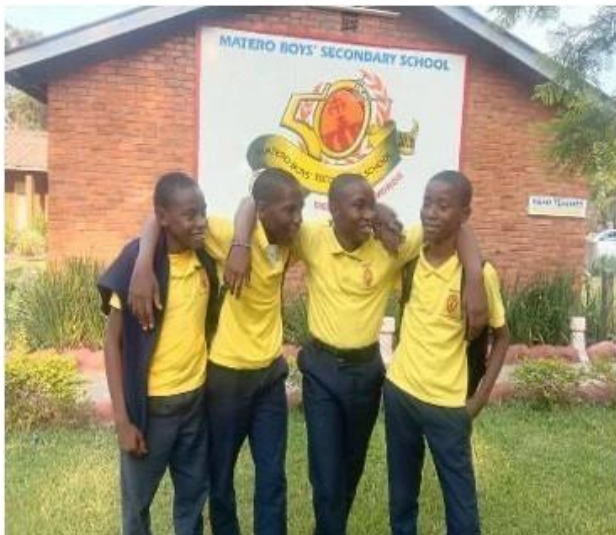
Élèves de l'école marianiste St. Joseph Chapel de Matero, membres du groupe Faustino de l'établissement.

Le mouvement FAUSTINO est actif à Lusaka (Zambie) depuis plusieurs années. Il dispose d'une grande force, non seulement par rapport à ses membres, mais aussi par rapport aux actions de service qu'il mène.