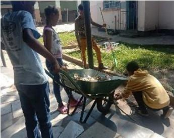
Jeunes du groupe Faustino en Zambie effectuant des travaux d'intérêt général.