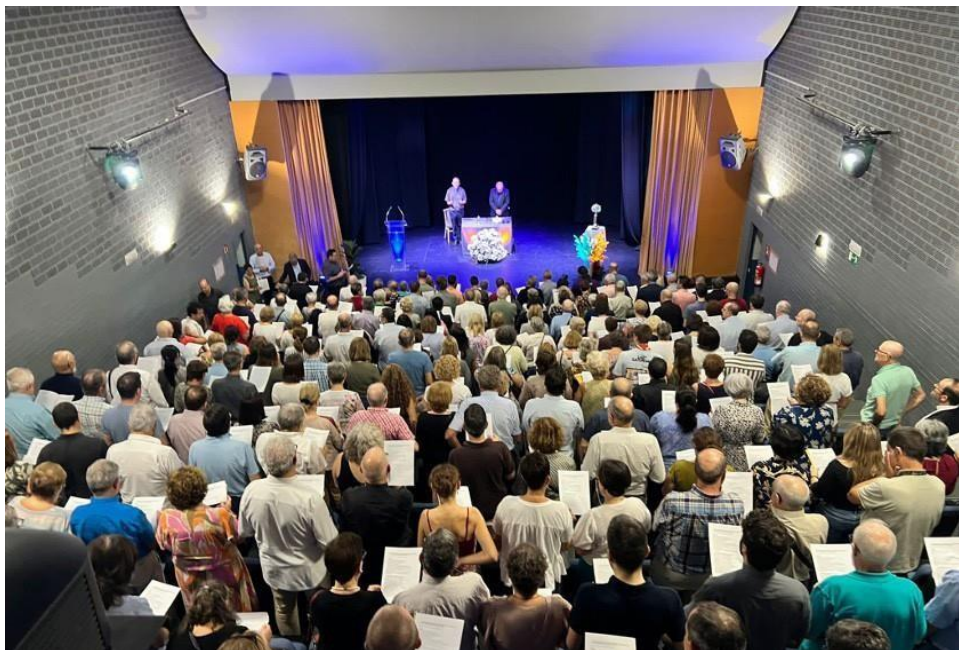
Auditorium du Colegio del Pilar de Valencia (Espagne). Photo de l'assemblée.

Tout le monde a eu la possibilité de recevoir des informations sur Faustino