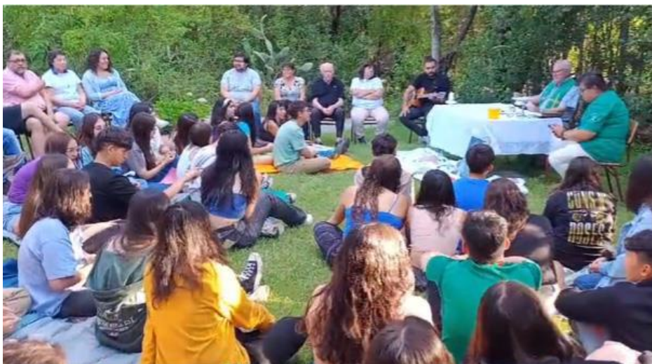
Messe célébrée pendant le camp d'été du Mouvement Faustino en janvier dernier Les quatre branches de la famille marianiste présentes au Chili ont été représentées.