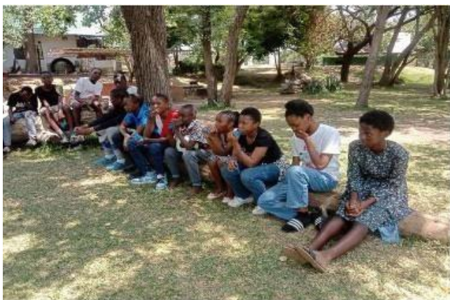
Pique-nique des Faustinos zambiens