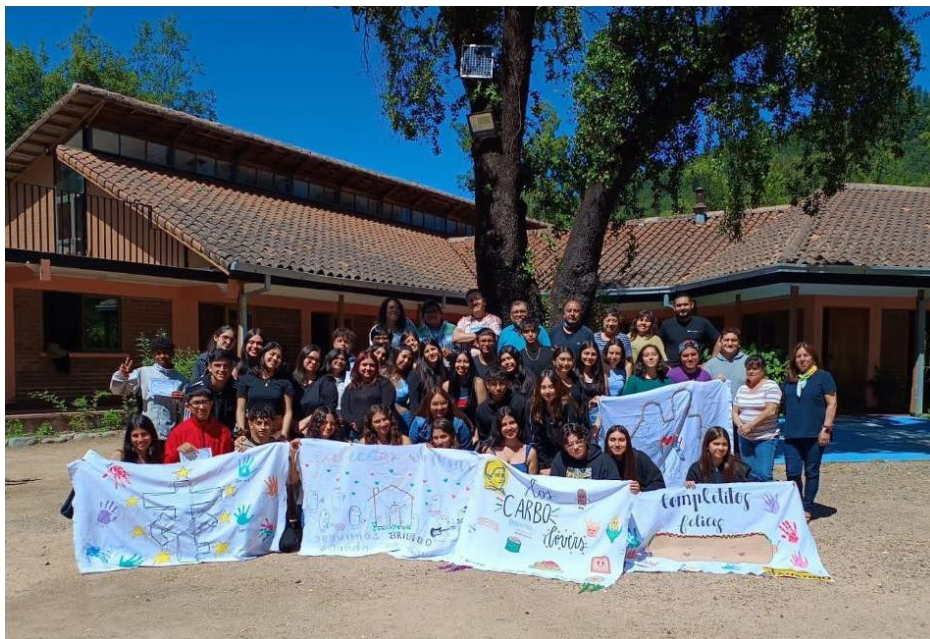
Photo de groupe des participants au camp du mouvement Faustino au Chili, janvier 2024.