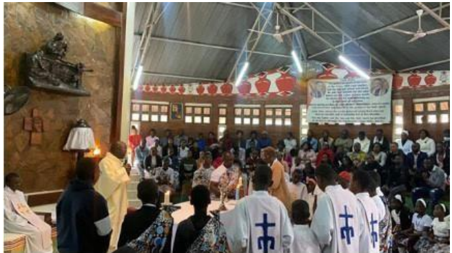
Célébration de l'Eucharistie communautaire des Faustinos.