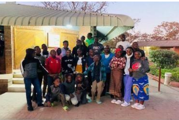
Membres du groupe Faustino assistant à l'adoration