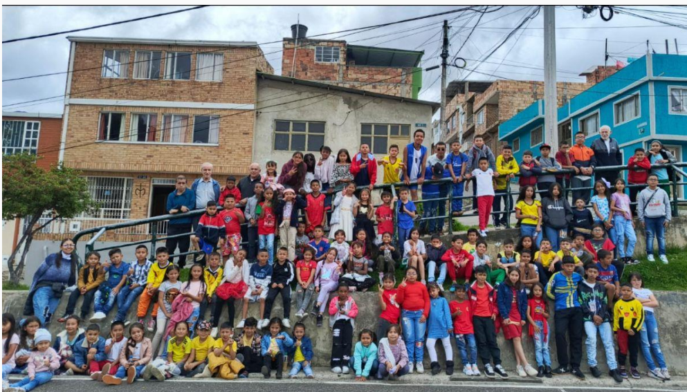
Bogotá, Enfants des centres d'aide-scolaire et frères devant la communauté de la paroisse Bienheureux Chaminade.

La Famille marianiste est aussi bien représentée en Colombie comme en Equateur, par une bonne présence de Communautés Laïques marianistes et des religieuses marianistes. C'est une chance pour tous.