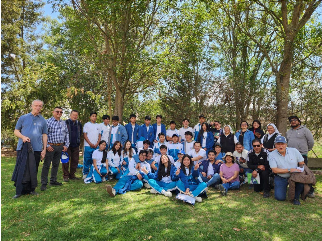
Avec des élèves, SM et FMI du collège Hermano Miguel (Latacunga, Equateur)

La Famille marianiste est aussi bien représentée en Colombie comme en Equateur, par une bonne présence de Communautés Laïques marianistes et des religieuses marianistes. C'est une chance pour tous.